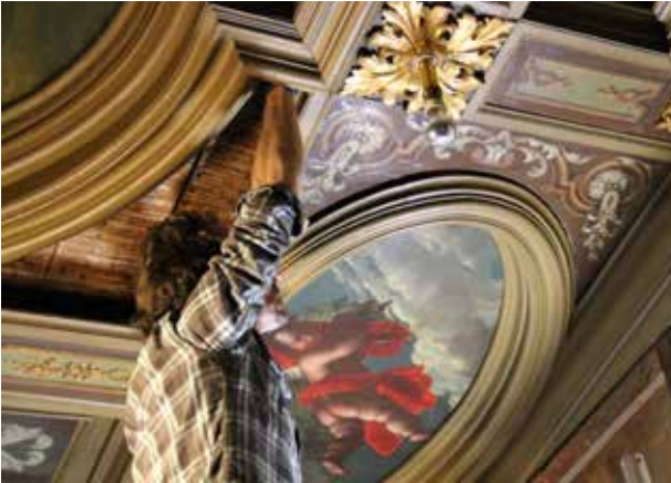
Restauratie van bijzonder, historische interieurs, ook in verhuurde huizen.

de monumentale waarden in een ruimteboek, alle onderzoeken in materialen en omgevingsgeschiedenis tot een handleiding voor housekeeping voor de nieuwe bewoners.