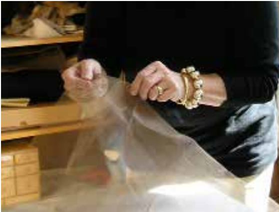
Vrijwilligers werken –onder leiding van een deskundig restaurator- aan het behoud van de textielcollectie.

Met inzet van vrijwilligers wordt onder leiding van een gespecialiseerde restaurator gewerkt aan het behoud van textiel. Komende periode worden de maatregelen om de collectie tegen schade van licht en UV te beschermen over alle musea uitgerold. Dit geldt in het bijzonder (of met name) voor textiel. De textielvrijwilligers dragen daar met hun werk op de Cannenburch al aan bij. Andere collectieonderdelen komen incidenteel aan bod, wanneer dit noodzakelijk is en de middelen voorhanden zijn.