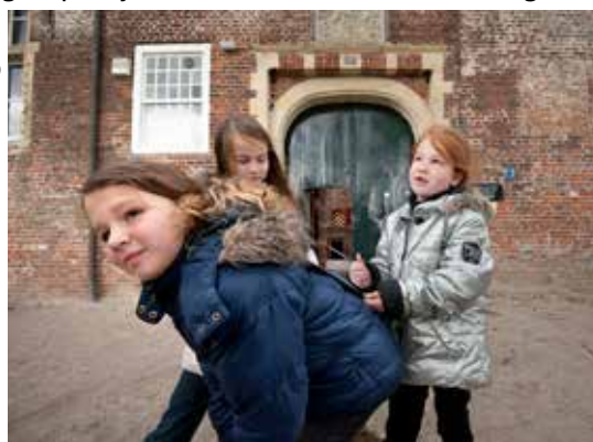
Educatieve programma's voor basisscholen op opengestelde kastelen.

Met veel inzet en adequaat gebruik van financiële middelen beheren we ons bezit. De praktische aanpak en specialistische kennis dragen we graag uit. Vooral bijzondere restauraties, benadering van grote projecten en housekeeping staan in de belangstelling. Afgelopen jaren waren dat de restauratie van kasteel Waardenburg en de nieuwe presentaties op Cannenburg en Verwolde.