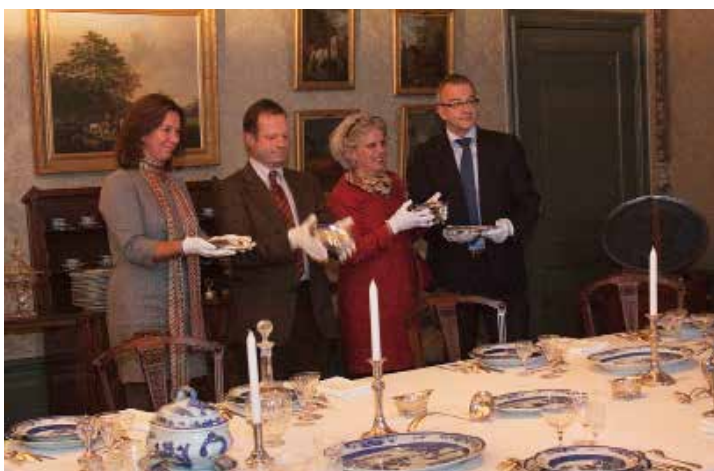
Objecten die aantoonbaar bij de bewoningsgeschiedenis aansluiten, willen we 'thuisbrengen'.

De (opengestelde) huizen en kastelen dragen bij aan de doelstelling van GLK door de geschiedenis te visualiseren. De daaraan gerelateerde collectie onderscheiden we als kerncollectie. Deze kerncollectie is onverbreekbaar verbonden met de geschiedenis van het huis en de bewoners. Interieuronderdelen zijn ook letterlijk fysiek aan het monument verbonden. Daarnaast koesteren we de voorwerpen waarmee de geschiedenis van het monumentale ensemble wordt gedocumenteerd en de objecten die de geschiedenis van een kasteel of landgoed versterken of voor de publiekspresentatie wenselijk zijn. Als een voorwerp ergens opduikt, op een veiling, dankzij relaties of speurwerk van de conservatoren, dat aantoonbaar bij een huis of de bewoningsgeschiedenis aansluit, willen we dat 'thuisbrengen' en in de context tonen.