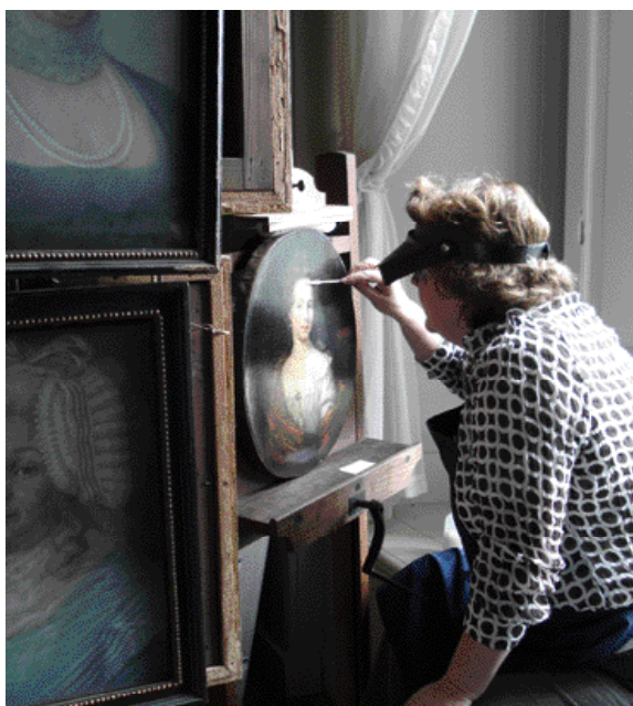
Een planmatige aanpak door meerjaren conserveringsprogramma's.

Scholing door de conservatoren van de direct betrokkenen in het omgaan met interieurs en voorwerpen van uiteenlopende maakt hen tot steunpilaren van het collectiebehoud. Vervolgstappen bij het behandelen van inventaris of objecten, zoals aanpassingen van standplaats of biotoop, vinden in overleg met de conservatoren plaats. Mogelijk ingrijpendere maatregelen worden onder leiding van de conservatoren aan specialisten toevertrouwd. Het vastleggen van procedures voor deze werkwijze en werkovereenkomsten met restauratoren zal verder worden uitgewerkt. Contacten met collega-conservatoren, maar ook met externe deskundigen van het Gelders Erfgoed, Instituut Collectie Nederland, Nederlandse Museumvereniging, Rijksdienst voor het Cultureel Erfgoed, Rijksbureau Kunsthistorische Documentatie de Britse National Trust en overige instanties, zorgen er voor dat onze kennis op peil blijft en vervolgens kan worden uitgedragen naar de uitvoerenden.