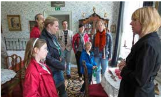
Erfgoed als tijdmachine.

De zichtbaarheid van ons bezit en de resultaten van ons werk zijn noodzakelijk om een maatschappelijk draagvlak te behouden. Voor monumenten spreekt zichtbaarheid min of meer vanzelf, maar voor de collectie interieurs en mobilia dient dat wellicht nog explicieter te worden gemaakt. Het nader te formuleren museumbeleid zal nadrukkelijk gaan over het betrekken van