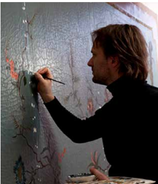
Omvangrijke restauraties kunnen alleen worden bekostigd uit incidentele middelen.

De dagelijkse zorg voor interieurs en collecties is in de begroting gewaarborgd vanuit de reguliere middelen. Continuïteit in onderhoud van de collectie op de huizen, het meerjarenprogramma voor preventieve conservering en het beheer van de mobilia op verschillende locaties en begeleiding door de conservatoren vormen hiervoor het fundament. Bijzondere projecten, zoals verwervingen, omvangrijke restauraties of het vernieuwen van de presentatie worden met aanvullende budgetten uitgevoerd. Deze zijn afkomstig uit bijzondere bijdragen, fondsen of andere incidentele middelen.