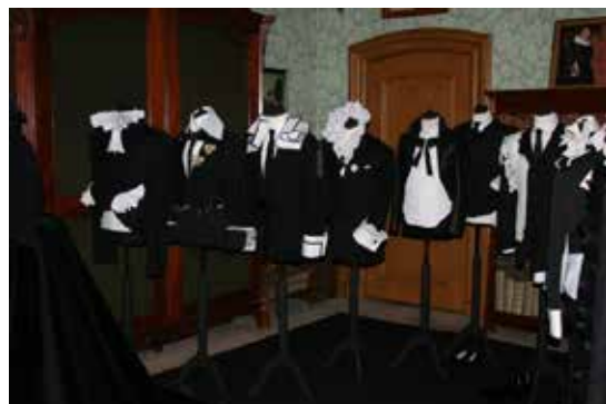
Presentatie van Ravage tijdens de Mode Biënnale 2013.

Regelmatig worden stukken aangeboden, maar alleen als deze in een van onze huizen geplaatst kunnen worden, accepteren we zo'n genereus gebaar. Bij inboedel legaten of schenkingen van objecten, waar geen specifieke voorwaarden of verplichtingen aan verbonden zijn, kan besloten worden deze af te stoten ten gunste van andere erfgoedinstellingen of ten behoeve van de instandhouding van de collectie.