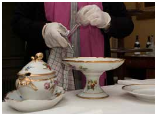
Zorg voor collecties door geschoolde medewerkers.

Het behoud van de collectie staat centraal bij het werk van allen, die betrokken zijn bij onze huizen, kastelen en andere monumenten. Kasteelbeheerders, rondleiders en vrijwilligers ter plekke en de conservatoren vanuit Zypendaal spelen allen een actieve rol, die -mits juist op elkaar afgestemd- het mogelijk maakt efficiënt te opereren. Continuïteit bij conditie monitoring, het registreren en documenteren is essentieel. Het overdragen van kennis en ervaring aan iedereen, die met de collectie in aanraking komt, is hierbij eveneens van groot belang. Eigenlijk begint het beheer en behoud het met traditioneel huishouden, dat in onze huizen is omgevormd tot een systematische aanpak. Deze aanpak noemen we 'housekeeping'. Een term die we hebben overgenomen van de National Trust.