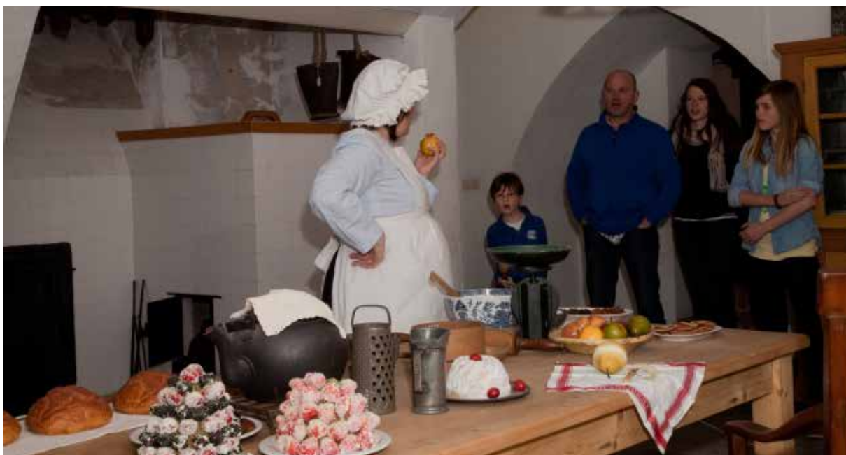
Gastvrijheid in de leefwereld van de vroegere bewoners.

Dankzij schenkingen, nalatenschappen en incidenteel aankopen is de collectie in de loop van het bestaan van beide stichtingen organisch gegroeid. We delen de zorg hiervoor met de huidige bewoners of gebruikers van de huizen. In onze zeven opengestelde huizen en kastelen bieden we daarnaast zelf gastvrijheid in de leefwereld van de vroegere bewoners en hun entourage. Hier kunnen we bezoekers van groot tot klein evocatieve handreikingen bieden over verschillende perioden van de geschiedenis van de notabele bewoners van Gelre tot Gelderland, hun huis, tuin en park. Tegelijk kan GLK in deze monumentale ensembles ook de eigen identiteit laten zien en verwijzen naar het overige, veelzijdige bezit. Bovendien ontvangen we graag gasten, die voor een bijzondere gelegenheid een inspirerende plek met een verhaal zoeken. Van collectie-registratie, housekeeping, veiligheidszorg, vernieuwing presentatie tot cateringovereenkomst; alles ten dienste van onze statutaire doelstellingen!