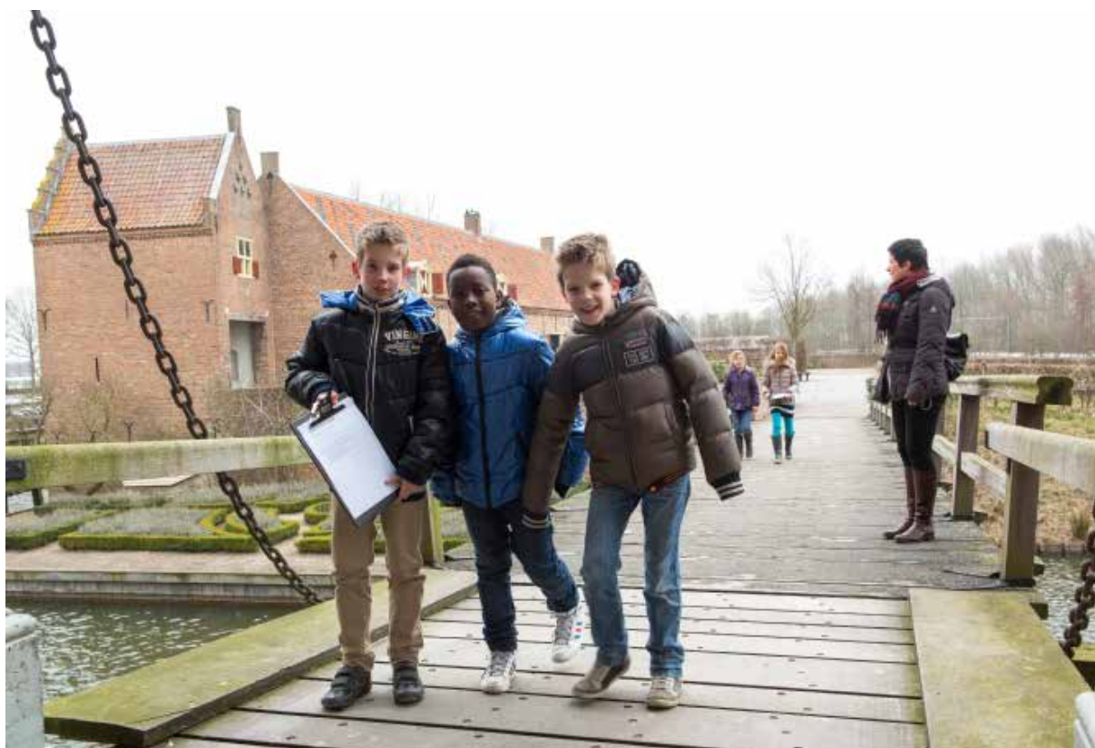
Educatie voor het basis- en bijzonder onderwijs verder uitbreiden.