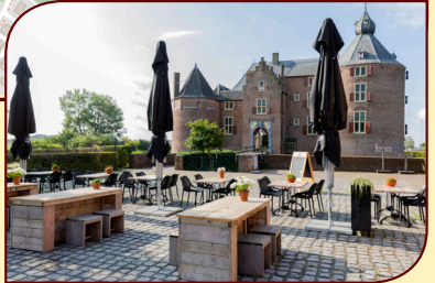
Kasteel Ammersoyen Kasteellaan 1 5324 JR Ammerzoden